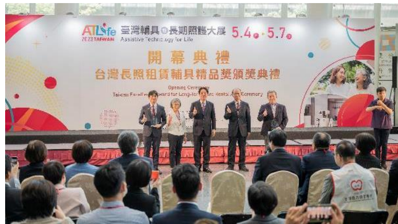
開幕典禮暨台灣長照租賃輔具精品獎頒獎典禮盛況