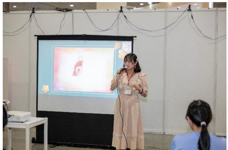
「愛無礙分享會」活動實況