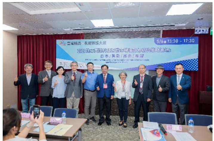
「政策及產業論壇」活動實況