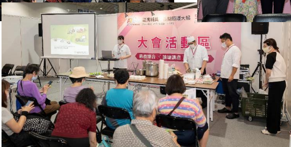
「大會活動區」活動實況