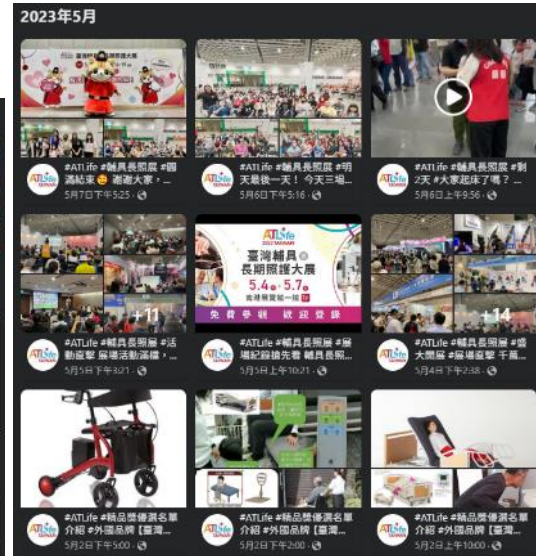
ATLife 官方粉絲團貼文露出

主辦單位長期深耕輔具及長期照護產業，與政府機關、各大輔具通路與長照機構合作，寄發紙本邀請函、海報觸及最核心的參觀族群， 宣傳對象包含中央及縣市級輔具中心管轄單位、藥局保健通路使用者、福利機構/基金會、非營利組織、物理/職能治療所、長照單位、相關校系等。